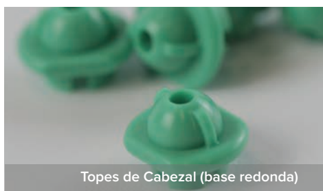
Topes de Cabezal (base redonda)