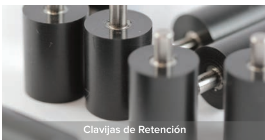
Clavijas de Retención