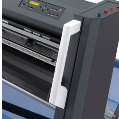
Robusta y Fácil de Mover