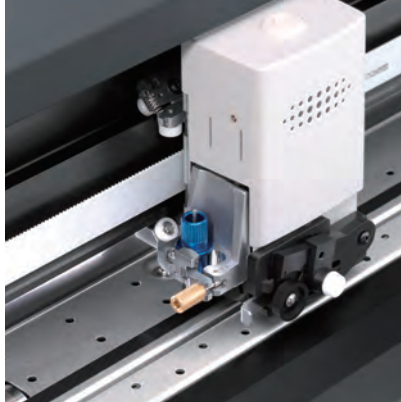
Sujetador de Cuchilla de Doble Posición